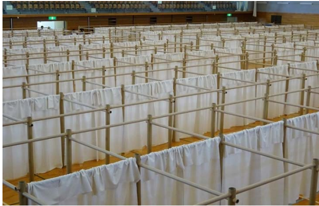
パーティションによる 個人空間の確保 (益城町 総合体育館)