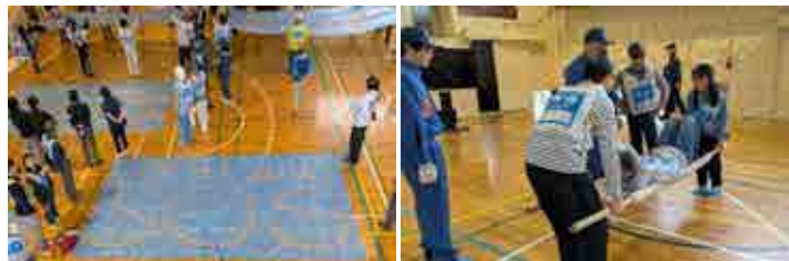
↑情報伝達訓練（イメージ）