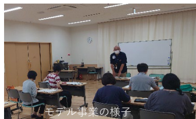
モデル事業の様子