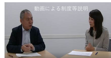
動画による制度等説明