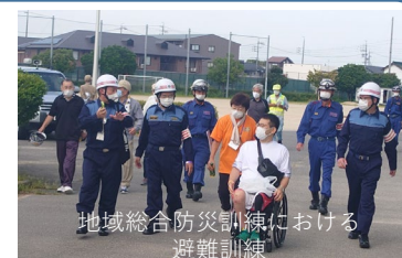
地域総合防災訓練における避難訓練