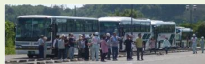
大規模河川氾濫時の他市町村への避難イメージ

災害発生のおそれ段階において、国の災害対策本部の設置を可能とするとともに、市町村長が居住者等を安全な他の市町村に避難（広域避難）させるに当たって、必要となる市町村間の協議を可能とするための規定等を措置。