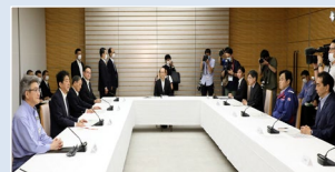
令和2年7月豪雨時の非常災害対策本部