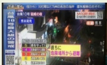
避難情報の報道イメージ（内閣府で撮影）

避難勧告・指示を一本化 し、従来の勧告の段階から 避難指示 を行うこととし、避難情報のあり方を包括的に見直し。