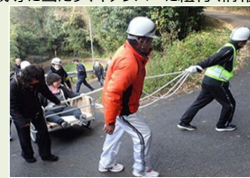
避難行動要支援者が災害時に避難する際のイメージ