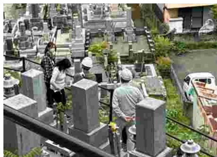
台風15号の被災者宅の裏山を 検分する技術士、弁護士、 支援相談員

また、支援相談員が、頻繁に被災者と同行して士業の無料相談ブースに相談に来てもらうことで、弁護士会や士業連絡会による無料相談会の活用促進にもつながっています。