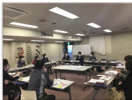
熱海土石流の災害ケース会議 に弁護士が参加する様子

弁護士会では、いずれの災害でも、ケース会議に毎回弁護士を複数名派遣し、生活再建の支障となる相続、債務などの法律問題の解決への助言や、支援制度の活用アドバイスなどを行っています。