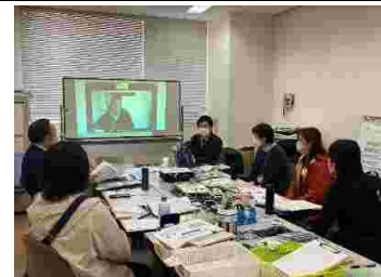
台風15号におけるセンターでの研修の様子

大きな災害で仮設住宅の入居開始等の時期に設置される被災者の見守り支援のための地域支え合いセンター。熱海土石流では熱海市と熱海市社協の共同で、台風15号では静岡市を委託者、静岡市社協を受託者としてそれぞれ設置されました。いずれの災害でも、弁護士会は、設置後間もない時期に、職員向けの支援制度研修を実施しています。被災者を直接訪問する支援相談員が健康、福祉のみならず支援制度の知識を持つことが被災者の再建には重要となります。熱海土石流では、住宅金融支援機構に要請し、センター職員向けに災害復興住宅融資、特にリバースモーゲージ型融資についての説明会も実施しました。