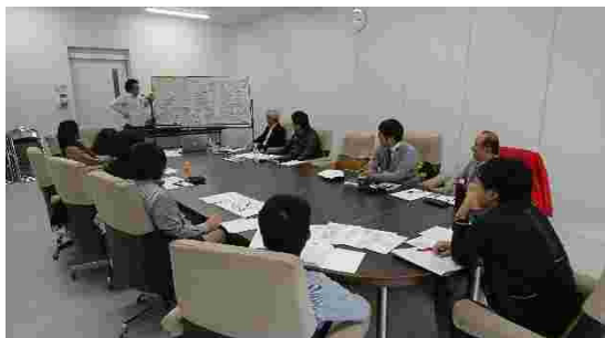
ケースカンファレンス会議

この個別ヒアリング支援で最も大切にしたのは、各個別ヒアリングを単発の相談で終わらせずに、各個別ヒアリングで得られた情報を共有し、課題を協議し、各被災者に対し、フィードバックする仕組みを作ることでした。そこで、個別ヒアリングとは別日に、支援関係者が集まり、「ケースカンファレンス会議」を定期的に開催しました。