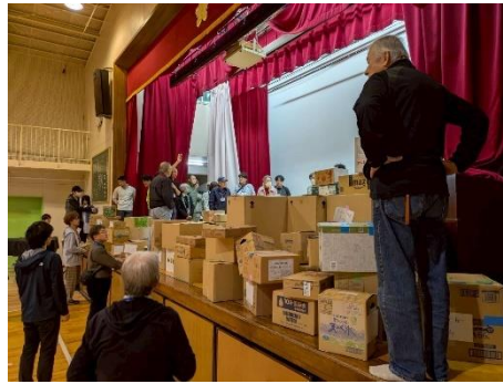
救援・支援物資受入れ訓練の様子