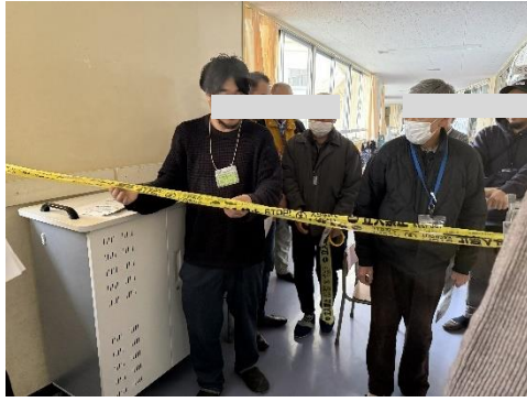
避難者の管理方法の実証実験の様子