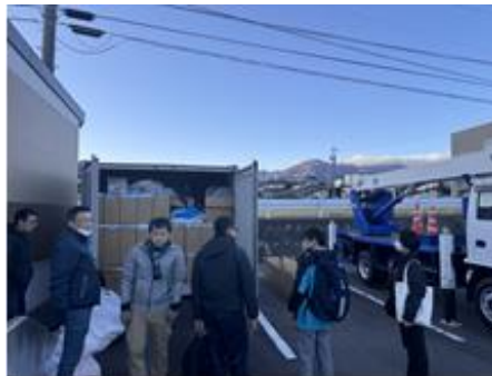
災害時支援ネットワーク実践セミナーの様子