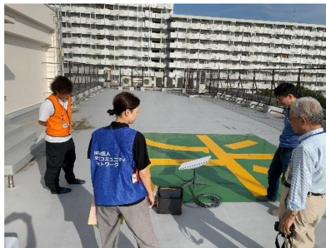
スターリンク訓練の様子

低軌道衛星スターリンクを活用した通信環境実証実験した。避難所となる学校校舎の屋上にスターリンクを設置し通信が可能か調査し、問題なく接続できた。設置から稼働まで、さほど難しい操作もなく、高齢な方でも問題なく操作できた。避難所運営連絡会としても導入を検討している。