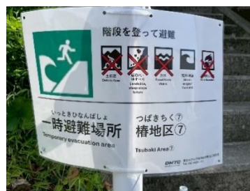
設置した防災標識