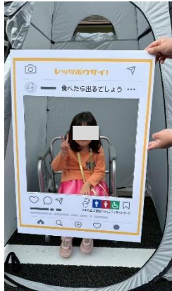
トイレ体験の様子