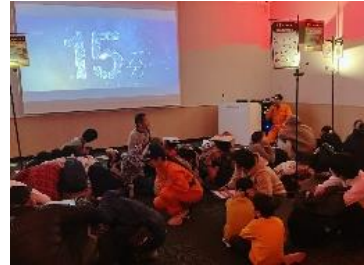
防災アトラクションの様子