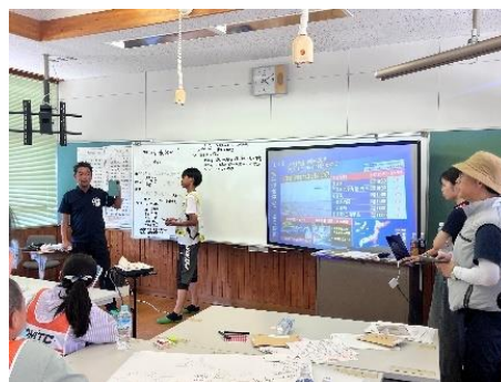
避難所運営の様子

津波警報発令のため運営訓練は実施せず、代わりにホワイトボードに実際の災害情報を整理する活動を参加者全員で行った。また、研修実施場所が実際の避難所として開設されたため、避難者の受け入れの一部を研修参加者が担った。