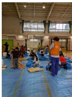
寝袋を使った体験の様子

避難所の一人当たりのスペースをブルーシートにマーキングし実際に寝袋、毛布を使って寝心地や避難者同士の距離感を体験した。レイアウトに関しては、避難してきた住民が迷わないためと管理しやすくすることを目的に、町会ごとに区画を割り振りレイアウト図に落とし込んだ。