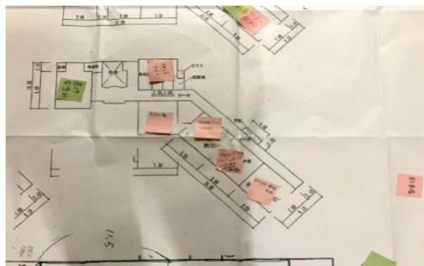
開設訓練で提案された避難所レイアウト

上記の成果が得られた一方で、プライバシーや遺体の扱いに関する考慮が不足する傾向が見られた。