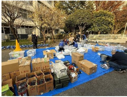
物品運び出し訓練の様子