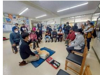
バリアフリー防災訓練の様子