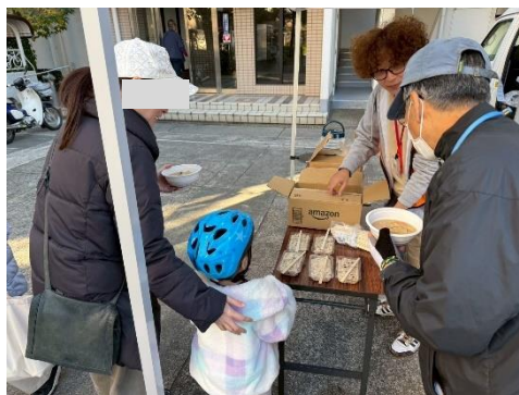
炊き出し訓練の様子