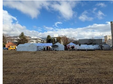
「避難・支援拠点」の設置（松本市）