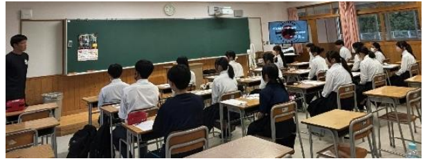
リーダー育成研修の様子