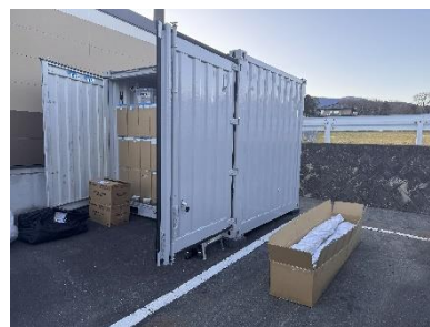
「(仮想)備蓄拠点」の設置