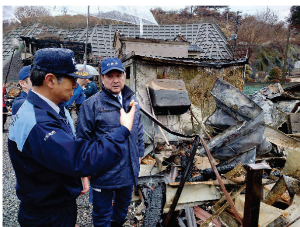
集落被害状況視察 【三陸町綾里港地区】