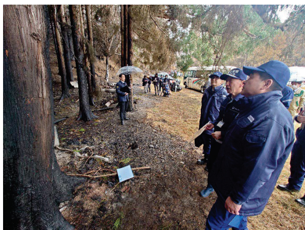
林業被害状況視察 【赤崎町合足地区】