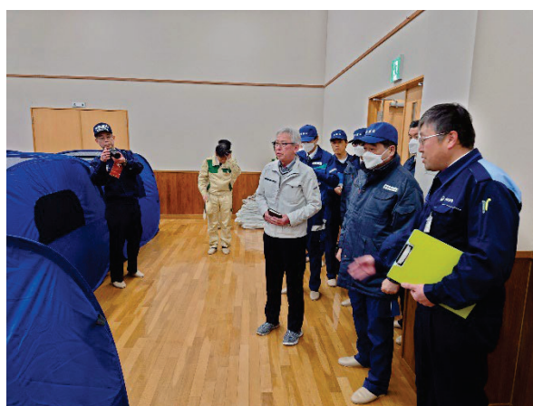
避難所視察 【大船渡市綾里地区コミュニティ施設・綾姫ホール】