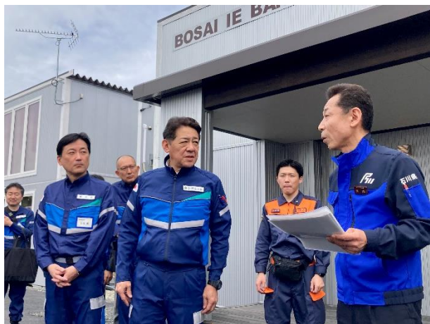
支援者宿泊拠点 【能登空港】