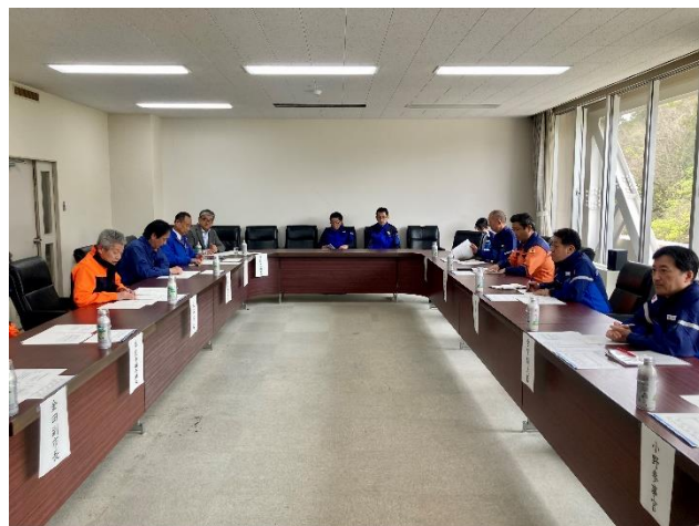
意見交換 【珠洲市役所】