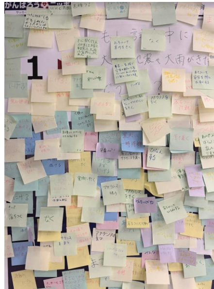
来場したファン・サポーターからの非常に多くの付箋のメッセージが寄せられた