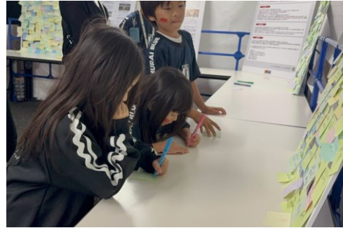
パネルと付箋を用いたワークショップには、日本代表ユニフォームを着た子どもたちが多数参加

開催地の富士市のスポーツや防災の関係者との連携が新たに生まれた。今後の防災活動の地域への展開の可能性を考えることができた。