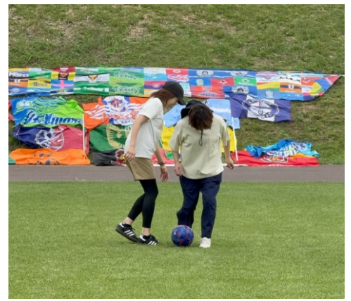
東日本大震災の被災地支援のサッカークラブの旗とともに大人も一緒に参加