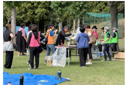
ハラル対応の炊き出し

提供者側では、スポーツイベントと防災教育を自然に組み合わせる実践手法を検証することができた。参加者側では、身体を動かしながら交流することで心理的なハードルが下がり、防災に関する会話や地域の記憶を共有する機会が生まれた。また、東日本大震災をはじめとする各種大規模災害を経験していない小学生も、サッカーのコミュニティが大規模災害時に重要な役割を担えることを学ぶ機会ができた。