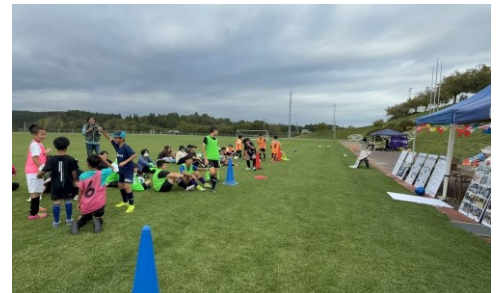
地域の大人が子どもたちの声を聞きながら防災について考える時間を設けた

事業内容② 防災啓発ブース の設置 (実施日:南三陸 町 10/5、札 幌市 1/6-7、 熊本市 1/10-11)