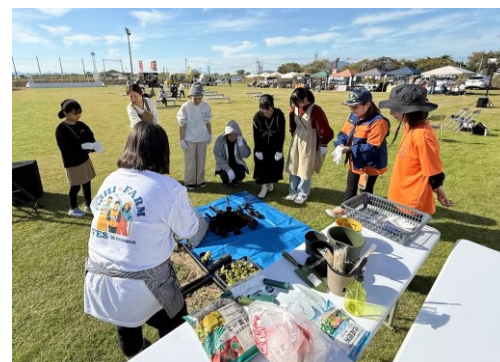
地域団体も多数参加して行った防災拠点オープニングイベント