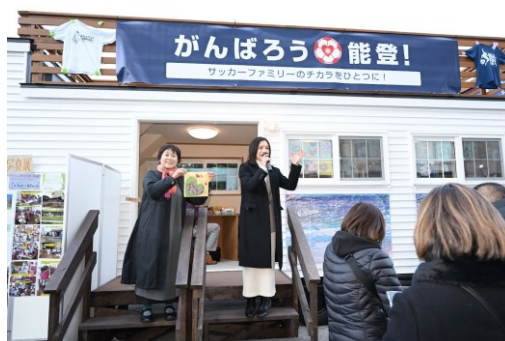
元なでしこジャパンの鮫島彩さんも参加し、一緒にワークショップへ参加