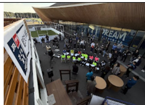
防災拠点のトレーラーハウス前で実施した、「ゆめのたねの教室」