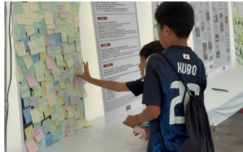
試合場で災害が起きたときの命を守る行動の大切さと、日頃からの備えやコミュニティのつながりの重要性を考えるワークショップのプログラムを新たに構築