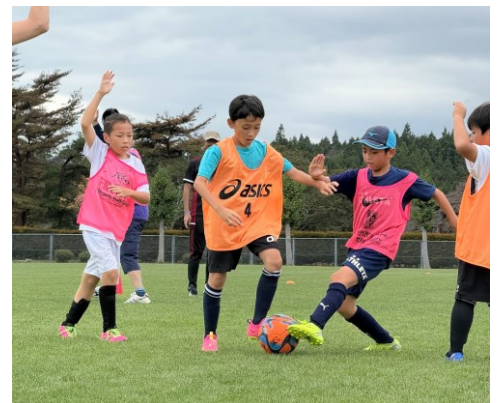
ウォーキングフットボールで交流