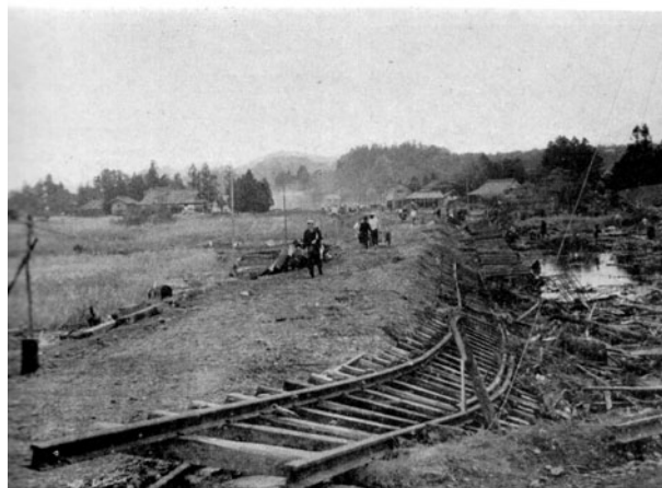
陸前高田市 松原海岸近くの大船渡線の被害状況（気象庁技術報告第8号、昭和35年）

電柱の倒伏も数多く、電気復旧の難問となった。八戸火力発電所が浸水被害を受けた。世界初の発電所被災である。浸水深はせいぜい50cm程度であったが、44台のモーター吊り上げなどに警報解除前である