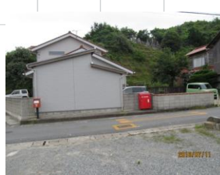
消火栓 No.6 中川橋付近