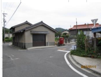
消火栓 No.5 倉谷川付近