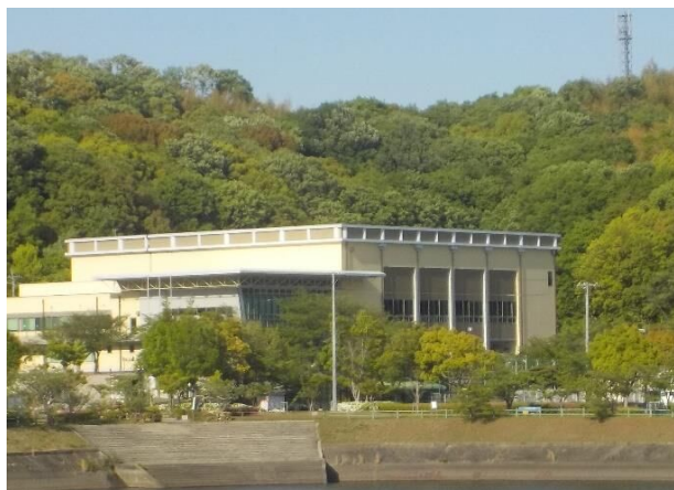
真備運動公園 体育館