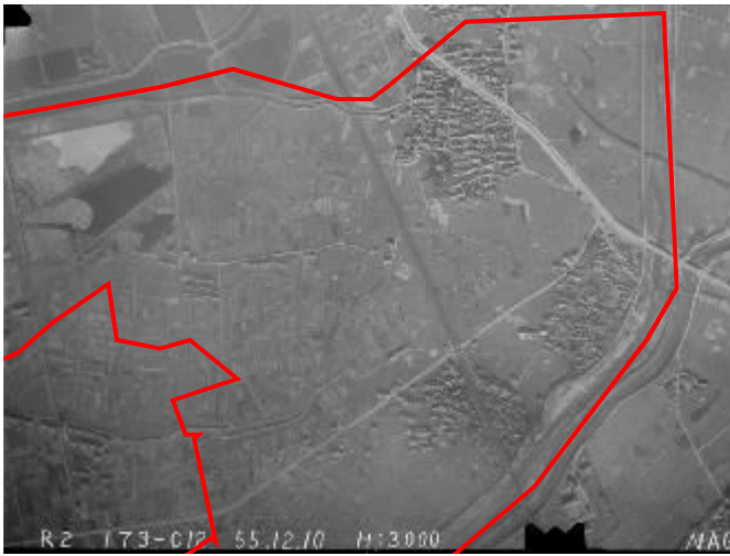
昭和 30 年(伊勢湾台風前)の航空写真