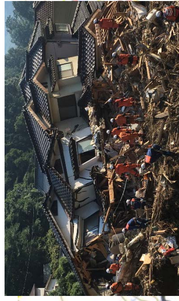
広島市安芸区上瀬野における搜索活動 【兵庫県大隊】