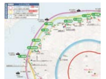
【火山防災マップの例（桜島）】

火山防災マップの配布等により、避難場所等、円滑な警戒避難の確保に必要な事項を周知