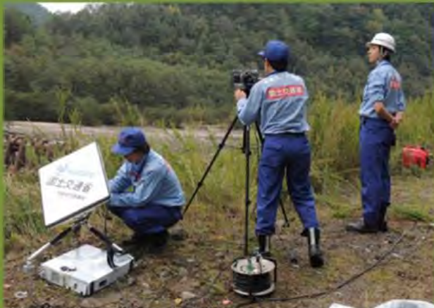
監視カメラ設置作業状況 (国土交通省)