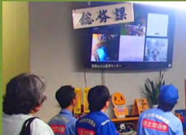
役場へのカメラ映像の提供状況 (国土交通省)