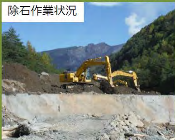
(木曽森林管理署HP抜粋)