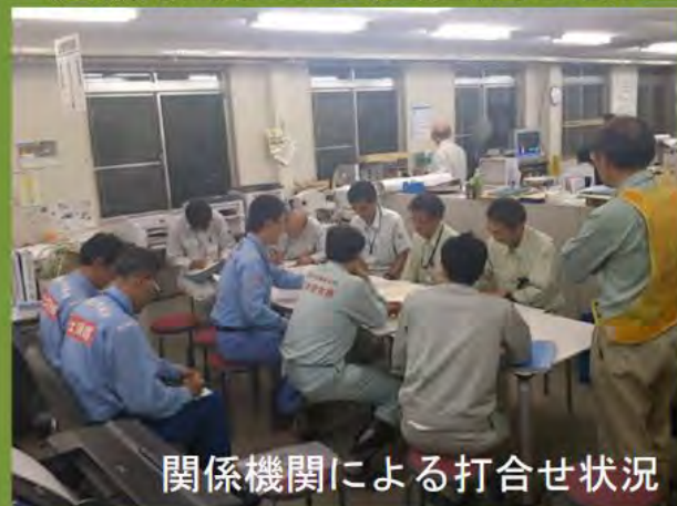
関係機関による打合せ状況