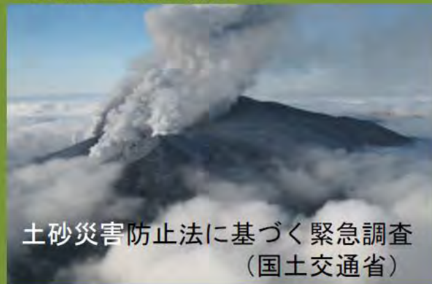
土砂災害防止法に基づく緊急調査 (国土交通省)