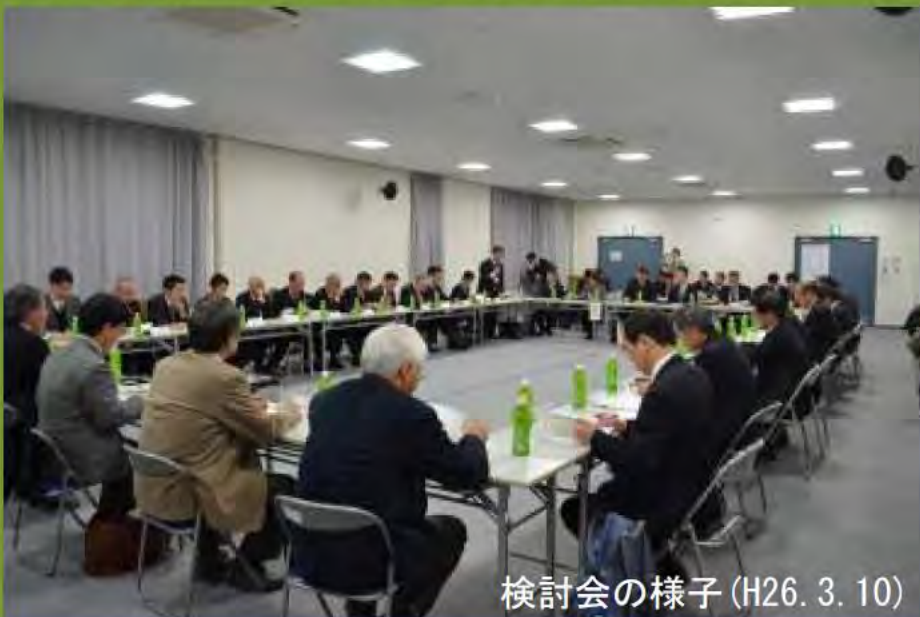
検討会の様子 (H26. 3. 10)