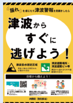
内閣府 津波早期避難意識啓発ポスター

津波からすぐに避難できるように、日頃から非常持出品を準備しておいたり、避難場所・避難経路を家族で決めておいたり、アプリやハザードマップを使って避難の訓練を行うことが重要です。