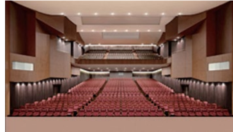
ニッショーホール(1000席)