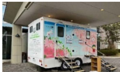
トイレトレーラーの例

▶災害時に活用可能なキッチンカー、トイレトレーラー、トレーラーハウス等を平常から登録・データベース化しておき、発災時にニーズに応じて迅速に提供する仕組みを創設する。