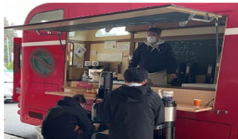
キッチンカーの例

トイレカー・トイレトレーラー、簡易トイレ、キッチンカー・キッチンコンテナ、炊き出し用資機材、パーティション、簡易ベッド、シャワーカー・仮設入浴設備 等