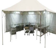
キッチン資機材の例