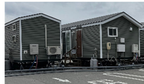
トレーラーハウスの例