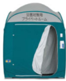
パーティションの例