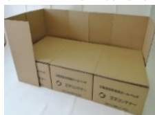
段ボールベッドの例

▶全国各地への迅速かつ確実なプッシュ型支援を可能とするため、立川防災合同庁舎に加えて、新たに全国7か所に、段ボールベッドやパーティション、簡易トイレ、温かい食事を提供するための資機材や入浴のための資機材等、調達に時間を要するため一定の備蓄が必要なものについて、購入・分散備蓄を実施する。