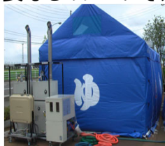
入浴のための資機材の例