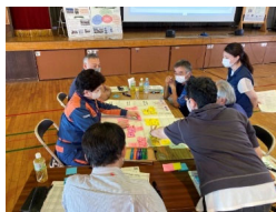
避難生活支援リーダー/サポーター研修

▶地域のボランティア人材育成のために、避難生活環境の改善のためのスキル・ノウハウを身につけてもらう「避難生活支援リーダー/サポーター研修」の実施地域を拡充する。