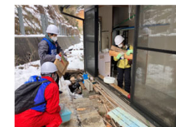
住家の片付けを行う一般ボランティア

▶遠隔地から支援に駆けつけるNPO・ボランティア団体等の被災者支援団体の交通費について、国費により被災者支援活動経費として一部補助することにより、被災者支援活動の活性化を図る。