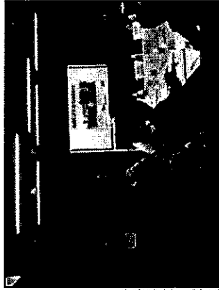
県外避難者交流会 (平成28年10月 大阪府)