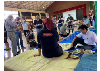
避難所の環境改善演習