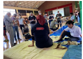
避難所の環境改善演習