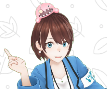
茨 ひより（茨城県公認VTuber）

災害ボランティア活動を迅速かつ円滑に行えるよう、茨城県災害ボランティアの登録を募集します。