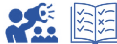
TTX試行、ガイドライン作成

③3か所程度でTTX試行するとともに、今後、各自治体が主体的に実施できるようガイドラインを作成し、次年度以降の普及を図る