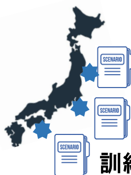
訓練シナリオ例作成

②3つの具体計画等を踏まえ、3都県程度の災害対策本部でのTTXの訓練シナリオ例を作成