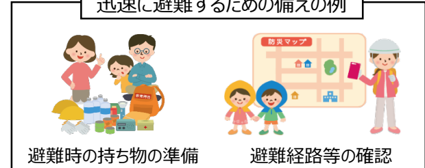
避難時の持ち物の準備