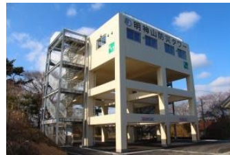
防寒機能付き避難タワー