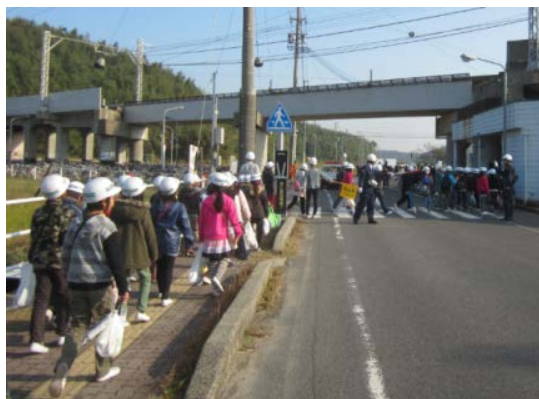
（津波避難訓練のイメージ）

糸満市、沖縄市、豊見城市、うるま市、宮古島市、国頭村、東村、本部町、恩納村、金武村、嘉手納町、中城町、西原町、与那原町、渡嘉敷村、座間味村、南大東村、八重瀬町、多良間村