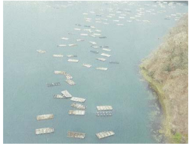
被災して漂流する養殖施設(岩手県大船渡湾)