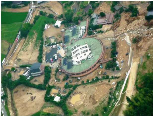
特別養護老人ホームの土砂災害現場 (山口県防府市)