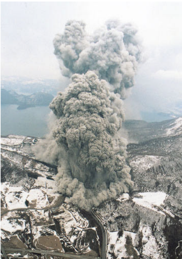
平成12年3月31日の噴火