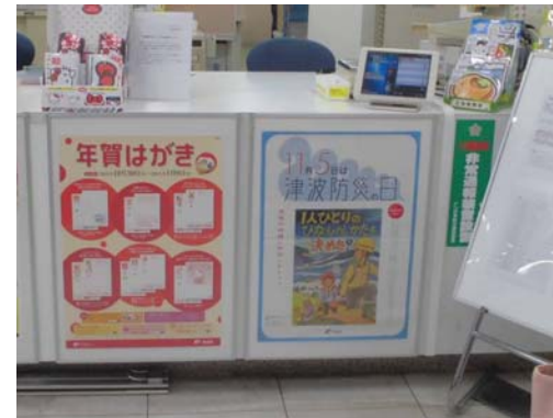
仙台東郵便局