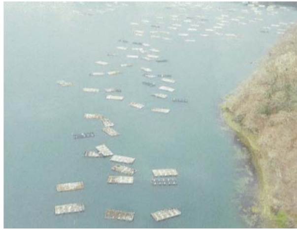
被災して漂流する養殖施設(岩手県大船渡湾)