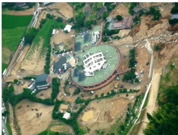
特別養護老人ホームの土砂災害現場 (山口県防府市)