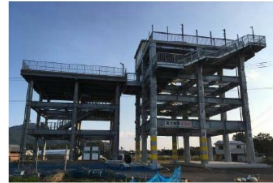
津波避難対策緊急事業計画作成自治体数