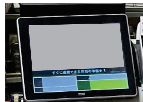
施設利用者等への情報伝達