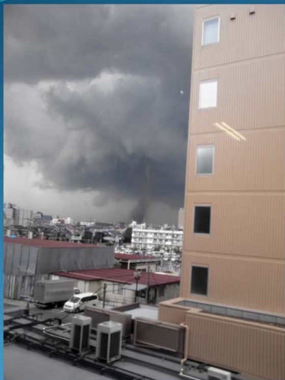
越谷市役所より撮影