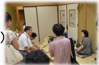
避難所を回る市長 9月2日