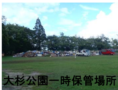
大杉公園一時保管場所