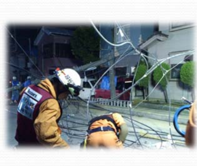
消防による復旧活動