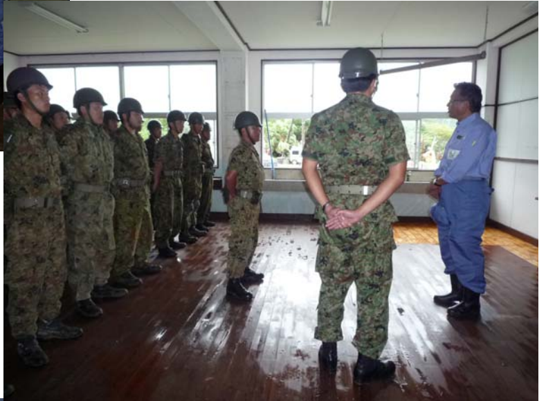
東城小中学校で学校再開に向けて活動する自衛隊を激励する東副大臣