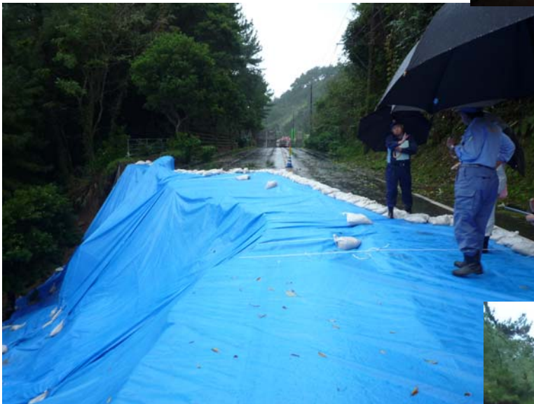
道路陥没による通行止め箇所を調査する東副大臣 (国道58号奄美市名瀬浦上、迂回路あり)