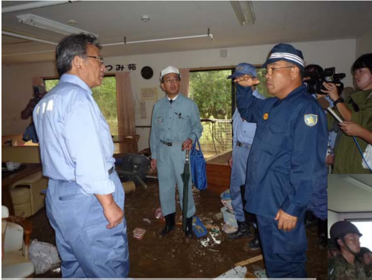
わだつみ苑の被災状況を調査する東副大臣