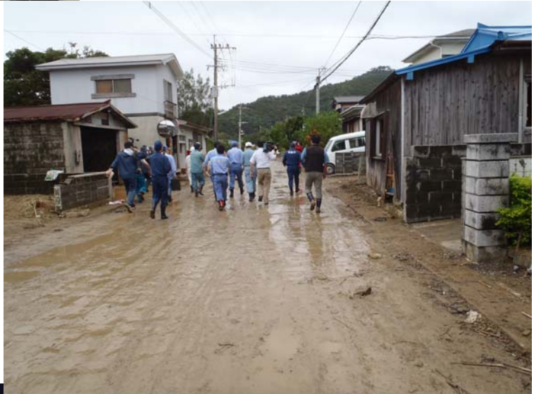
龍郷町戸口地区の被災状況