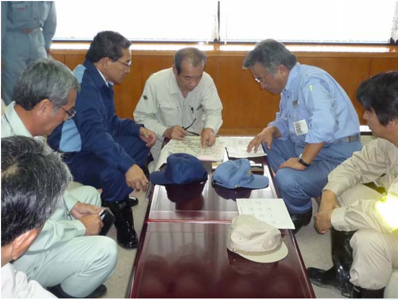
奄美空港で鹿児島県知事などから被災状況の説明を受ける東副大臣