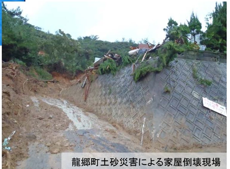
龍郷町土砂災害による家屋倒壊現場