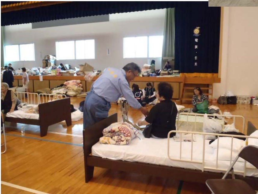
奄美体験交流館に避難されている方をお見舞いする東副大臣