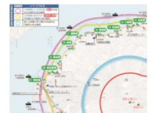
【火山防災マップの例（桜島）】

火山防災マップの配布等により、避難場所等、円滑な警戒避難の確保に必要な事項を周知