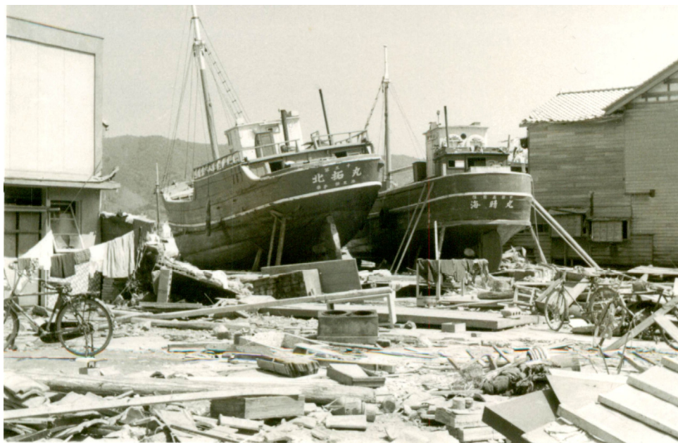
口絵3 東南海地震津波で打ち上げられた漁船（尾鷲港）（伊藤和明提供）