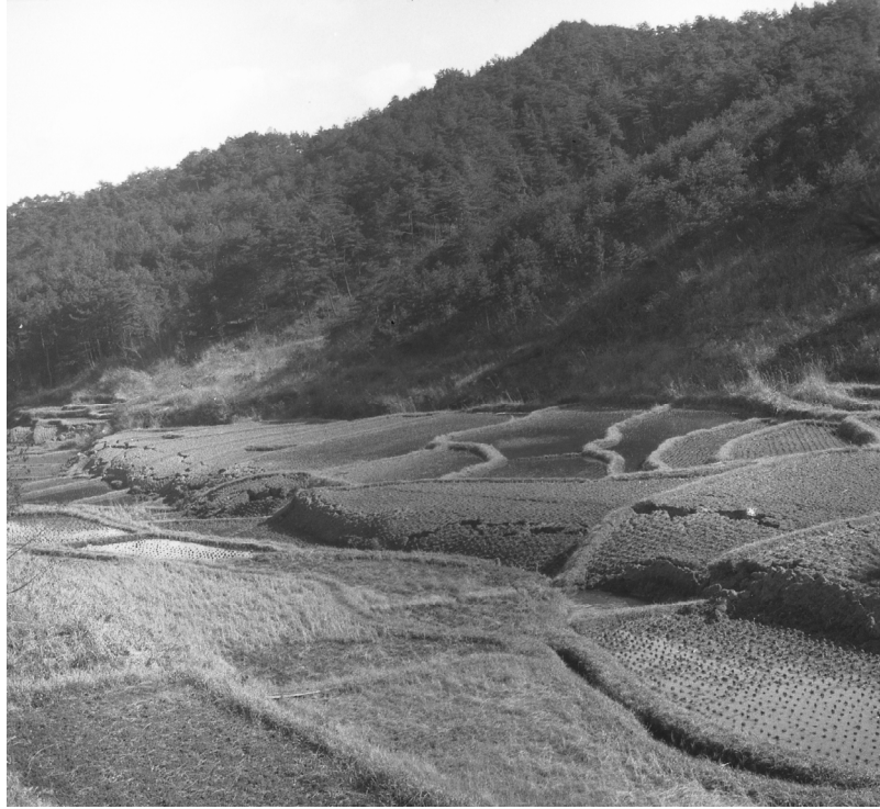
口絵1 1945年三河地震の地表地震断層 (木股ほか、2005)

(額田郡幸田町深溝の西深溝池東側に出現した地震断層 (深溝断層)。1945(昭和20)年2月)