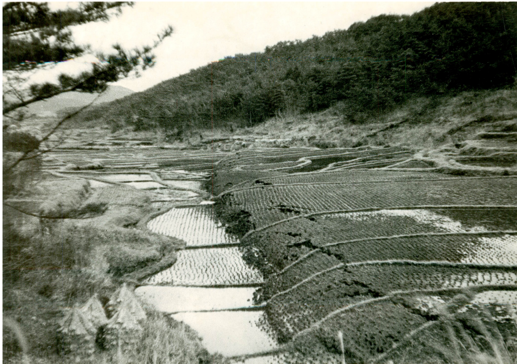
口絵2 深溝断層 (津屋弘達氏撮影、伊藤和明提供)

(額田郡幸田町深溝の西深溝池東側に出現した地震断層 (深溝断層)。1945(昭和20)年2月宮村攝三氏撮影)