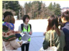
若手メンバーの活躍

地区のまちづくり活動の一環として、若手メンバーが防災学習プログラムを取り入れた宝探しゲームの企画+運営を主体的に担った。