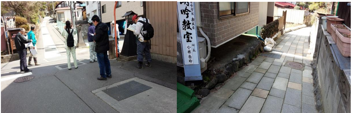
過去に水害が発生した場所