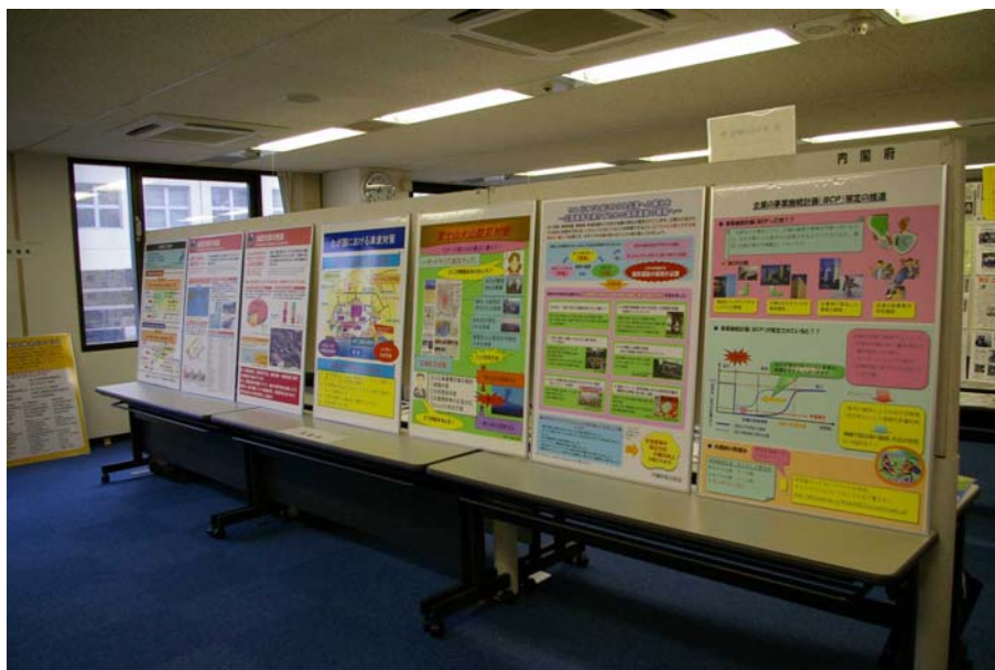
写真はパネルボード3枚