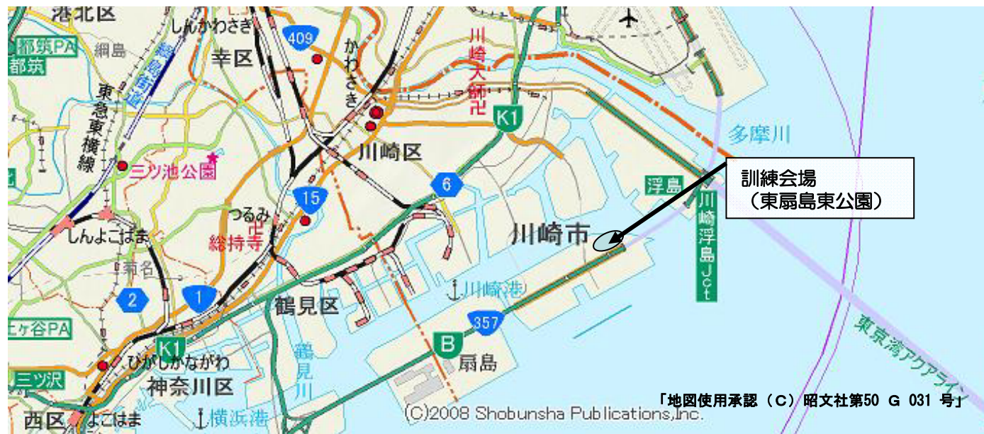
訓練会場（東扇島東公園）