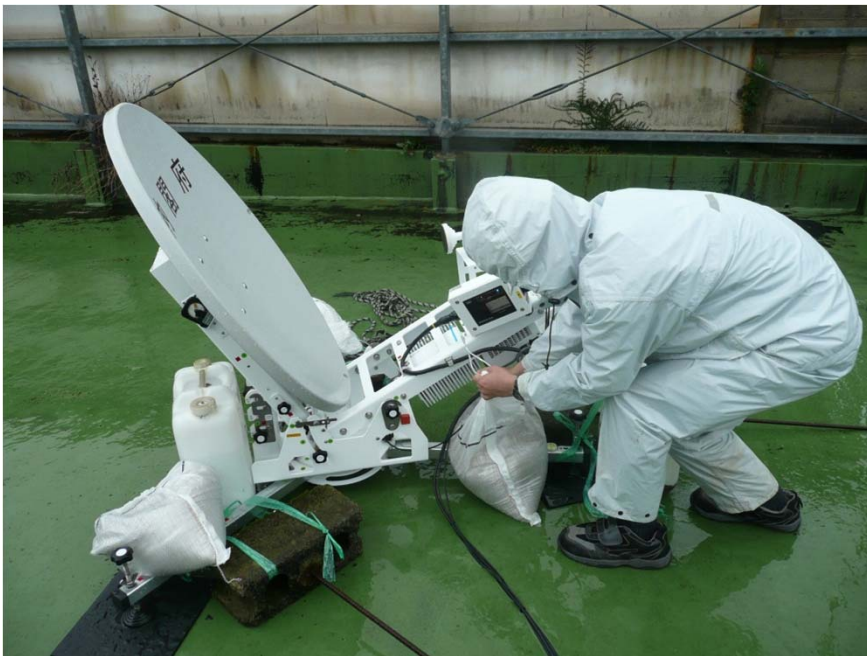
大島支庁に設置した 中央防災無線網 衛星通信装置

鹿児島県奄美市大島支庁に設置された政府現地連絡対策室と総理大臣官邸、内閣府(防災)はじめ防災関係機関との間に衛星通信回線を設置し、①内閣府災害対策関係省庁連絡会議の中央省庁及び政府現地連絡対策室へのライブ伝送、②政府現地連絡対策会議の中央省庁へのライブ伝送を実施した。