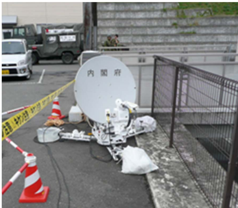
栗原市役所に設置した 中央防災無線網 衛星通信装置

宮城県栗原市役所に設置された栗原市災害対策本部、政府現地連絡室と総理大臣官邸、内閣府(防災)はじめ防災関係機関との間に衛星通信回線を設置し、①栗原市災害対策本部会議の中央省庁へのライブ伝送、②内閣府災害対策関係省庁連絡会議の栗原市へのライブ伝送、③報道へのブリーフィング状況の共有、④電話・FAXその他の通信を実施した。