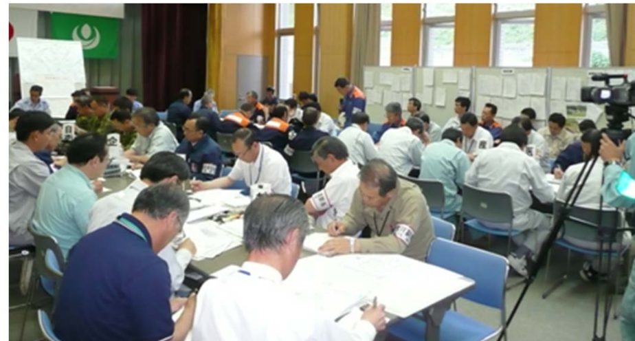
栗原市災害対策本部会議のライブ伝送