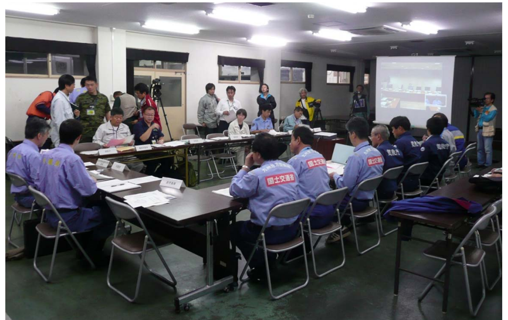
政府現地連絡対策会議のライブ伝送