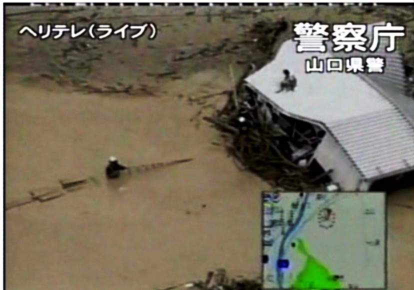
ヘリコプター映像例 平成21年7月中国・九州北部豪雨