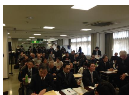
フォーラムの様子