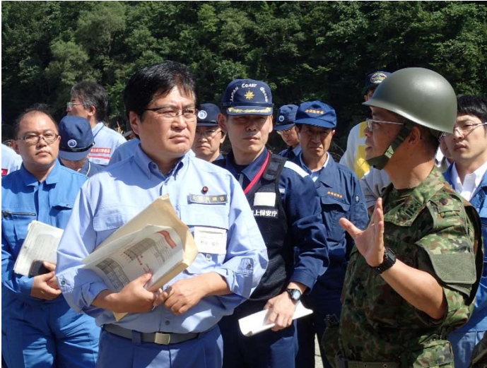
グループホーム被害状況調査 【岩泉町内】