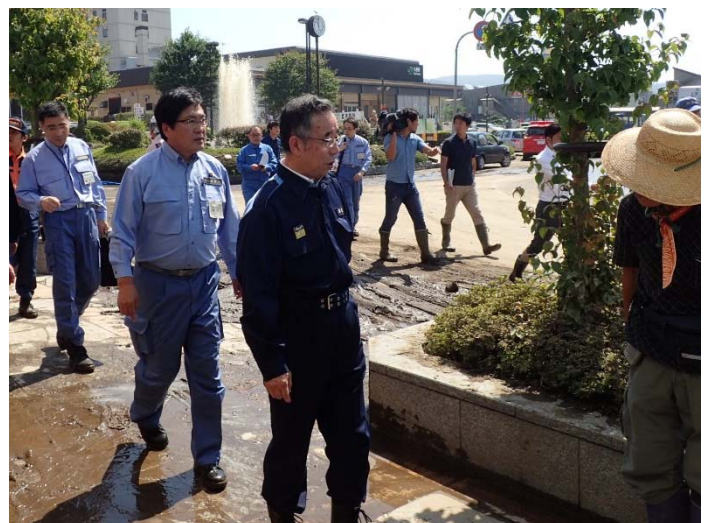
駅前付近被害状況調査 【久慈市内】