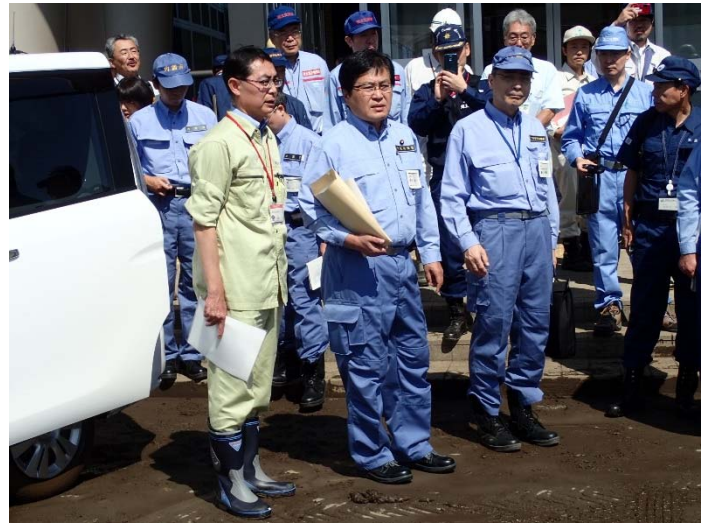
被害状況調査 【久慈市内】