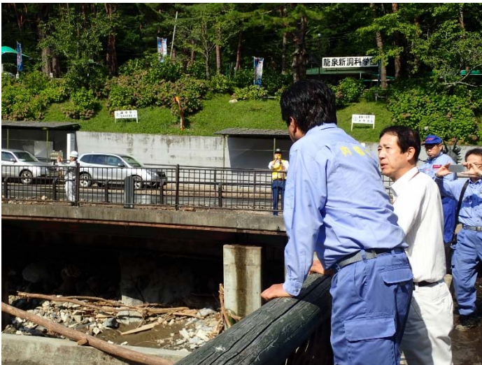
被害状況調査 【岩泉町内】