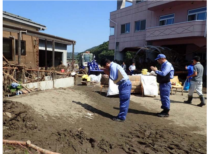
グループホームにて犠牲者への黙とう 【岩泉町内】