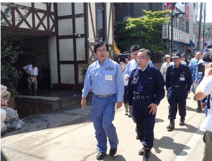
駅前付近被害状況調査 【久慈市内】