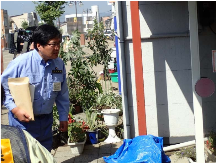
被害状況調査 【久慈市内】