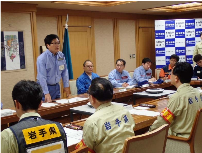
岩手県知事との意見交換 【岩手県庁】