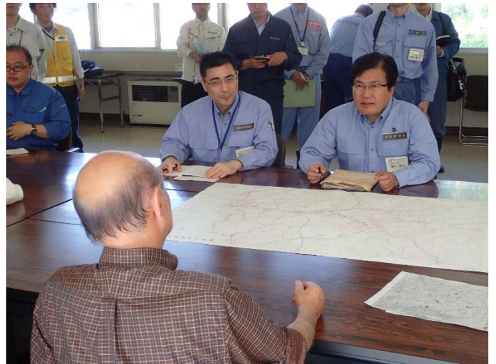
岩泉町長との意見交換 【岩泉町役場】