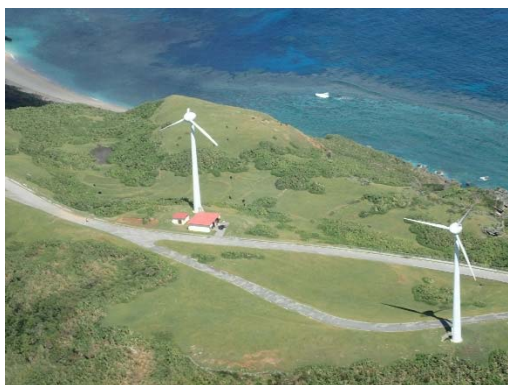
被災した与那国町の風力発電施設の様子 【沖縄県八重山郡与那国町】