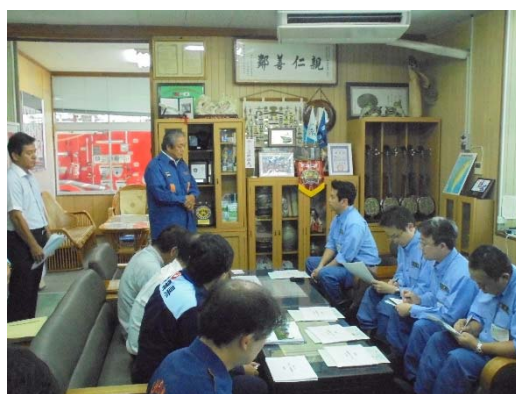
与那国町長と意見交換を行う松本政務官 【沖縄県八重山郡与那国町役場】