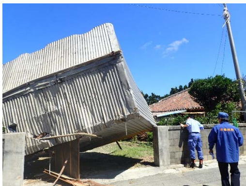
被災した与那国町の様子 【沖縄県八重山郡与那国町】