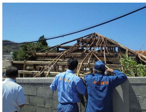
被災した与那国町の様子 【沖縄県八重山郡与那国町】