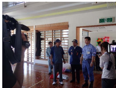
比川小学校の被害状況の説明を受ける松本政務官 【沖縄県八重山郡与那国町】