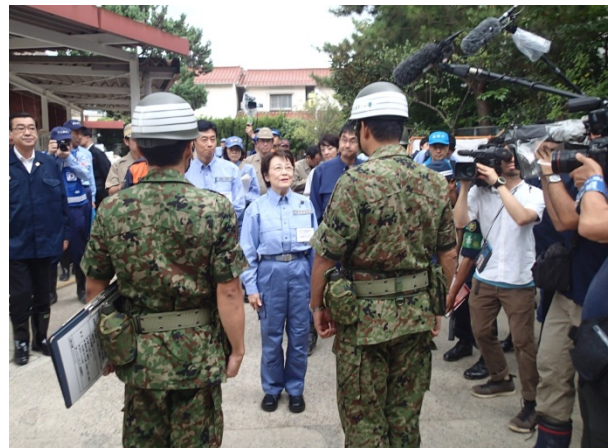
活動中の自衛隊員を激励する山谷大臣 【広島市安佐南区八木地区・梅林小学校】