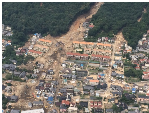
ヘリによる上空視察② 【広島市上空】