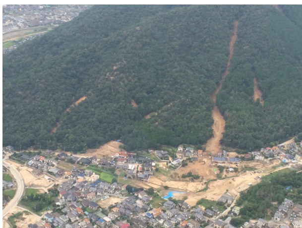
ヘリによる上空視察① 【広島市上空】