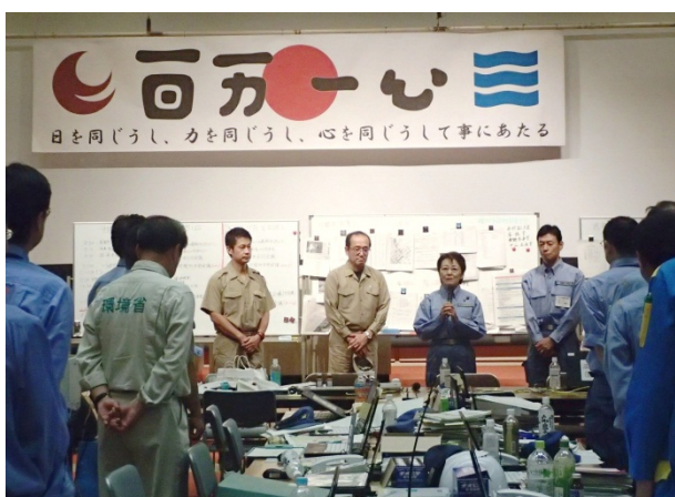
政府現地災害対策本部で激励をする山谷大臣 【広島市役所】