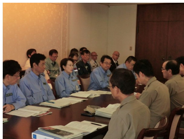
広島県知事、広島市長等との意見交換会 【広島市役所】