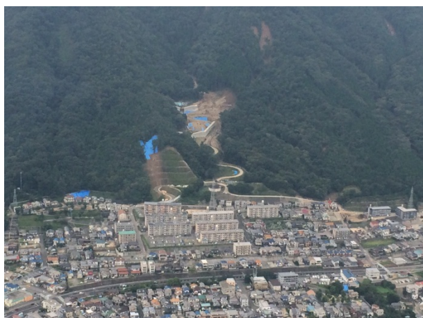
ヘリによる上空視察③ 【広島市上空】