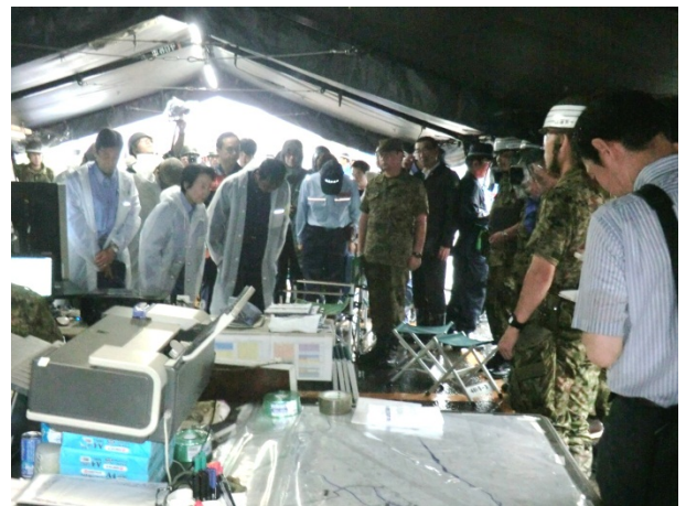
現地調整所で説明を受ける山谷大臣 【広島県広島市安佐南区八木地区】