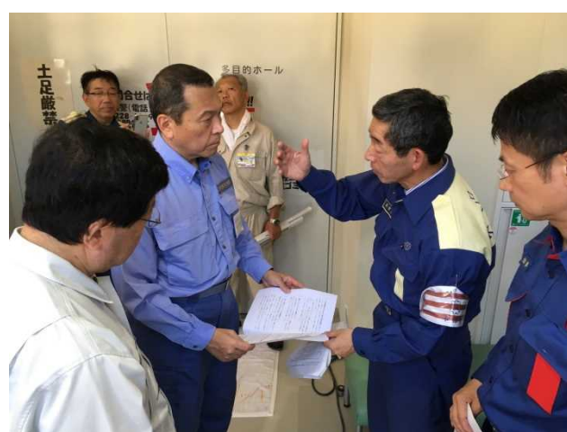
呉市内 避難所訪問② 【天応市民センター】