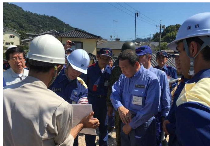
呉市内 土砂災害現場視察② 【天応地区】