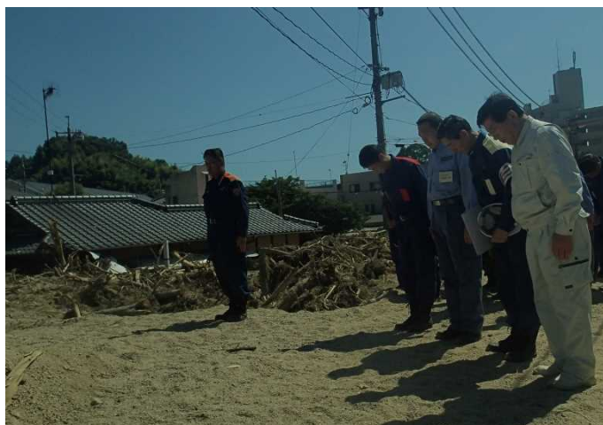
呉市内 土砂災害現場視察① 【天応地区】