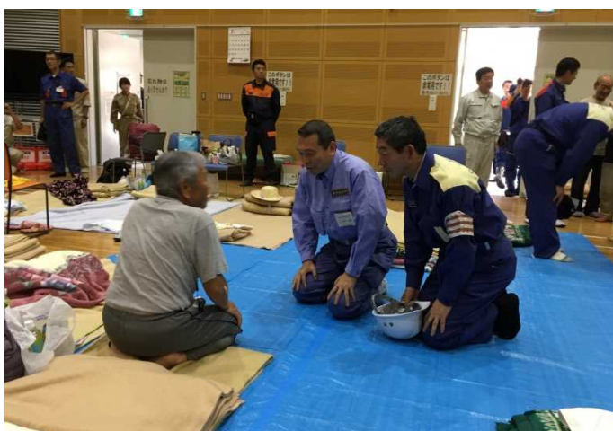
呉市内 避難所訪問① 【天応市民センター】