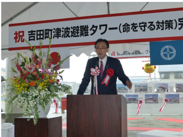
←津波避難タワー完成式典で祝辞を述べる古屋大臣 (津波避難タワー完成式典会場)