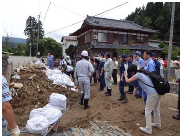
ボランティアによる土砂撤去の状況を調査する 長島政務官【長岡市乙吉町】