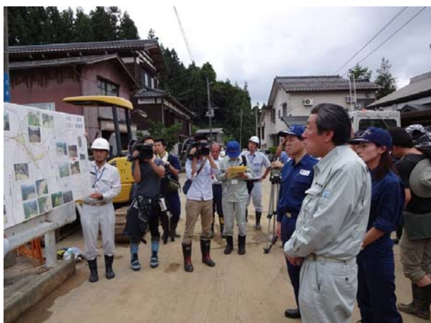
被害状況の説明を受ける長島政務官（手前） 【長岡市乙吉町】