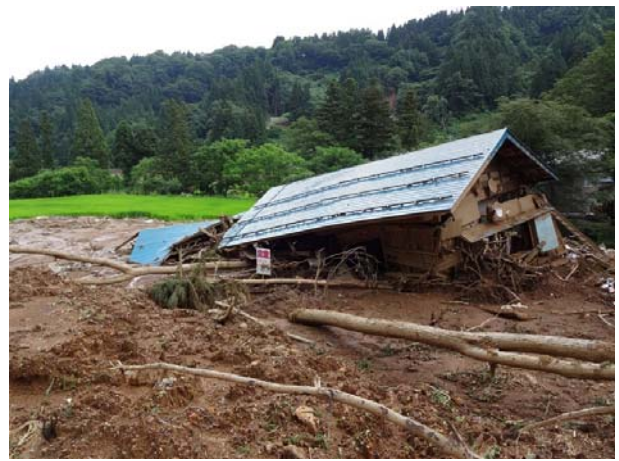
土砂崩れによる住家被害と水田への土砂流入状況 【長岡市森上地区】