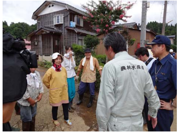
被災状況の聞き取りをする長島政務官【長岡市乙吉町】