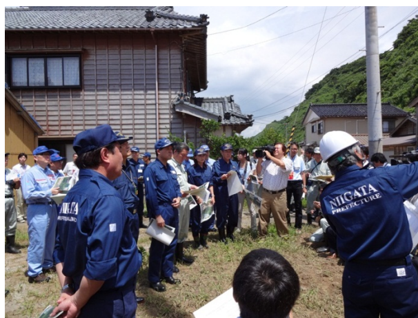
被害状況の説明を受ける政府調査団 【長岡市寺泊山田地区】