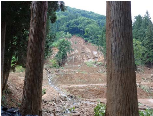
斜面崩壊状況 【長岡市森上地区】