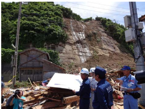
土砂崩れによる住家被害の状況 【長岡市寺泊山田地区】