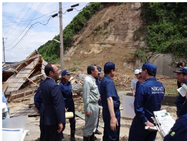
被害状況の説明を受ける長島政務官（写真中央） 【長岡市寺泊山田地区】