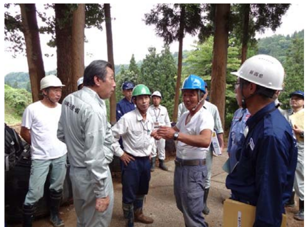
復旧作業中の地域住民からの被災状況の聞き取りをする長島政務官【長岡市森上地区】