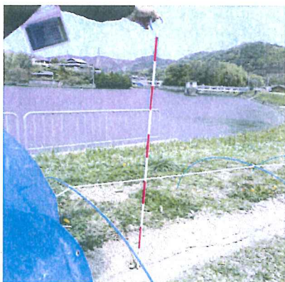
ため池の堤体天端の亀裂を調査【淡路市三宅谷池】