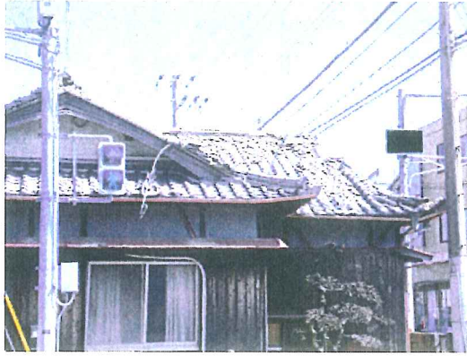
市街地の住家の被災状況を調査【淡路市内】