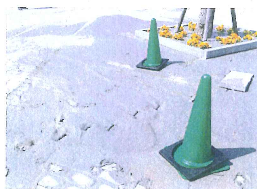
液状化の状況を調査 【淡路ワールドパークONOKORO】