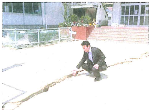
グラウンドの亀裂を調査【洲本第一小学校】