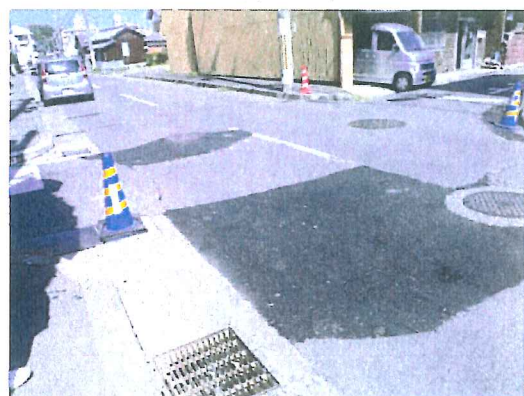
路面隆起後の仮復旧状況を調査【淡路市内】