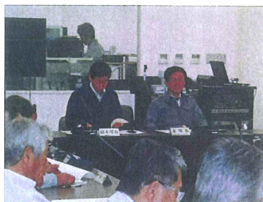
淡路市災害対策本部会議【淡路市役所】