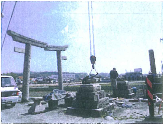
鳥居の一部崩落状況を調査【洲本市内】