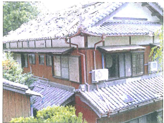
市街地の住家の被災状況を調査 【洲本市内（下内膳地区）】