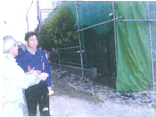
市街地の住家の被災状況を調査 【洲本市内（炬口地区）】