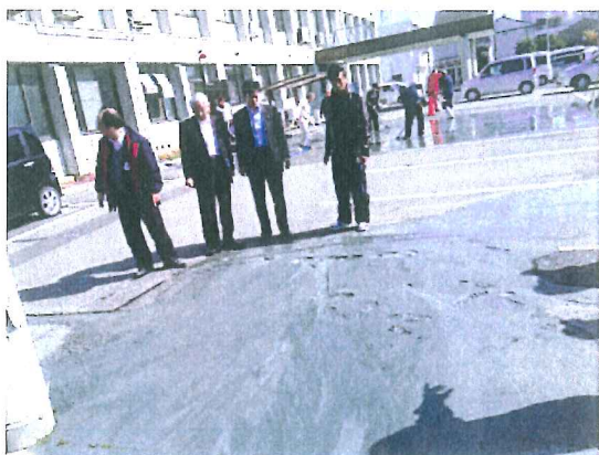
知事とともに液状化状況を調査【淡路市内】