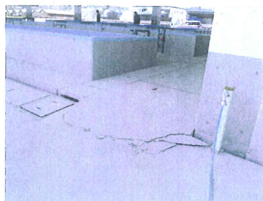
荷捌き場の段差を調査【淡路市生穂漁港】