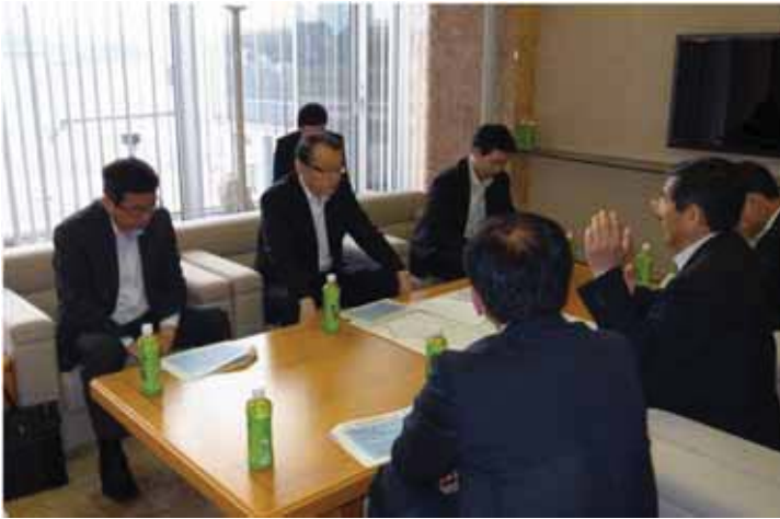
← 仁坂和歌山県知事から説明を受ける中川大臣（於：南紀白浜空港）