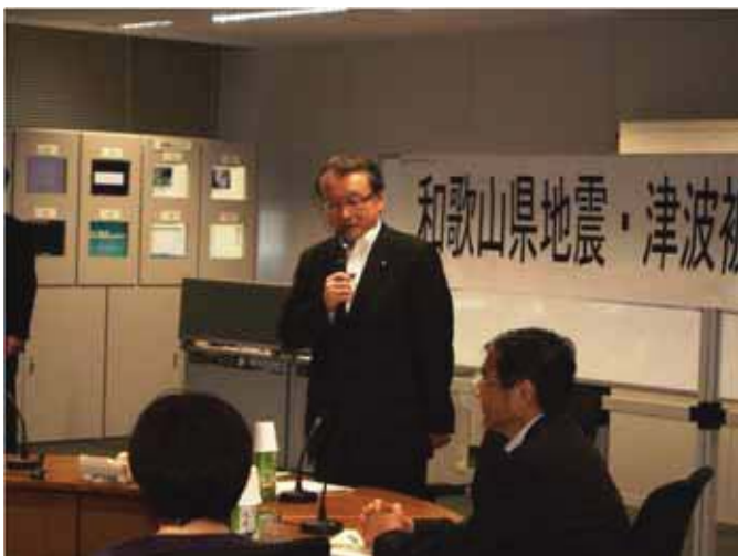
↑ 県の被害想定検討委員会で挨拶する 中川大臣 (於:県庁南別館)