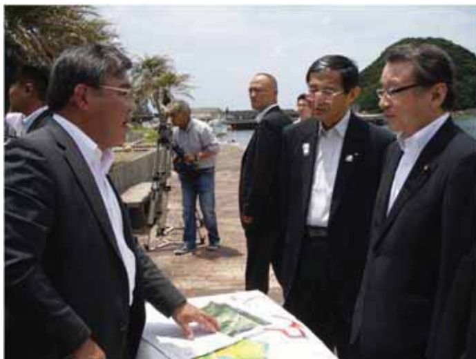
↑ 岩田すさみ町長から説明を受ける中川大臣（於：すさみ海水浴場前）