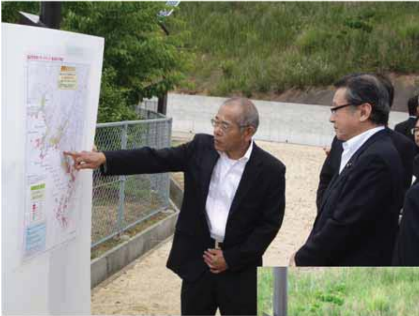
庄堂田辺市副市長から説明 を受ける中川大臣 ←(於:橋谷避難広場)