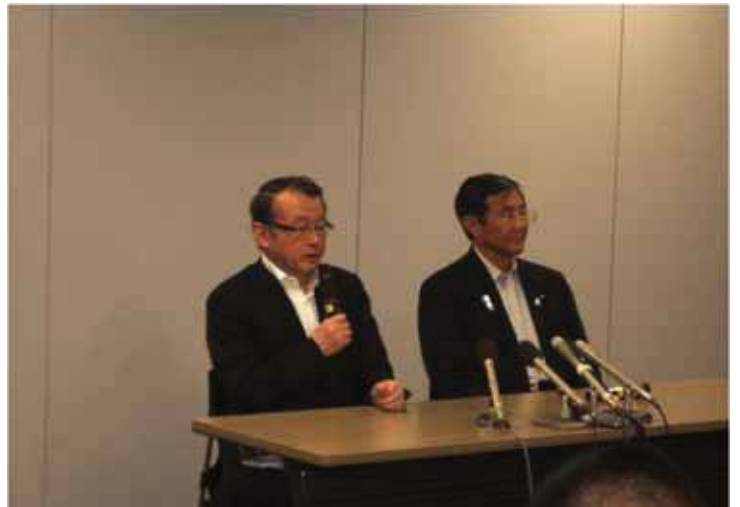
↑ 県庁内で仁坂知事とともに取材を受 ける中川大臣 (於:県庁南別館)